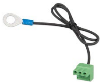
Złącze z fabrycznie zamocowanym ujemnym przewodem prądu stałego (w zestawie)