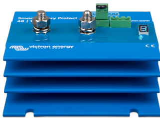
Smart BatteryProtect BP 48-100