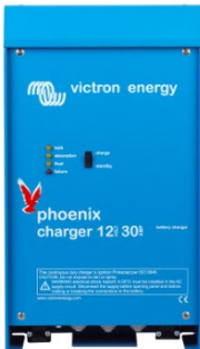
Ładowarka 12 V 30 A

Charakterystyka 4-stopniowego, adaptacyjnego ładowania: bulk (ładowanie prądem maksymalnym) – absorption (ładowanie absorpcyjne przy stałym napięciu) – float (ładowanie płynne) – storage (magazynowanie)